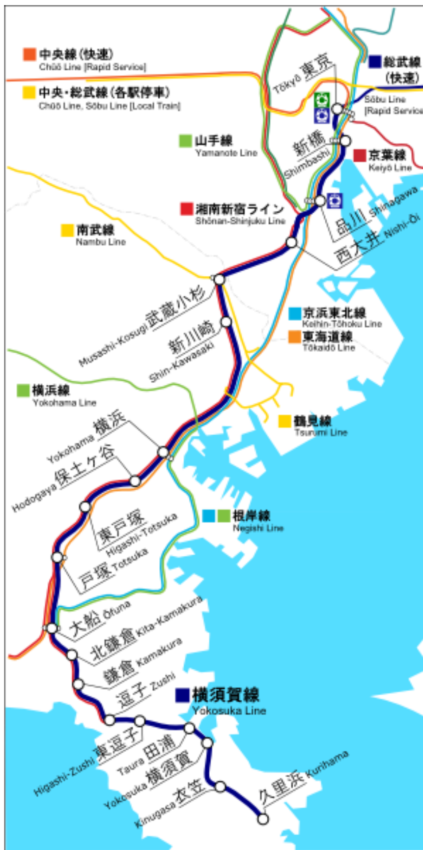
【JR 横須賀線の路線図】